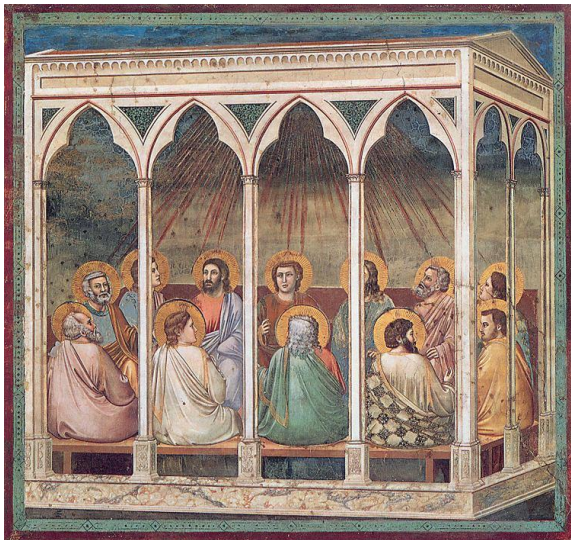
(Scrovegni kapel, Padua) Fresco van Giotto di Bondone (1266–1336)